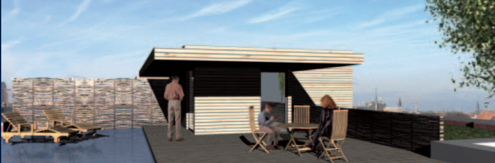
Dakterras - Loft