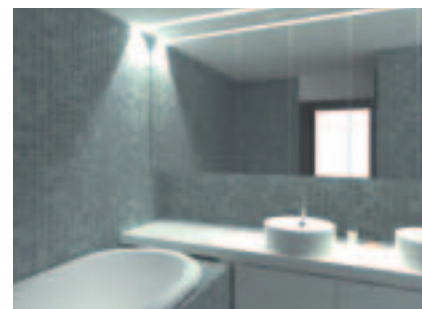
Badkamer - Appartement

Cotton Island ligt aan een stadspark van meer dan 5300 m 2 en wordt langs beide zijden ingesloten door twee Scheldearmen. De woongelegenheden zijn optimaal georiënteerd naar de zon.