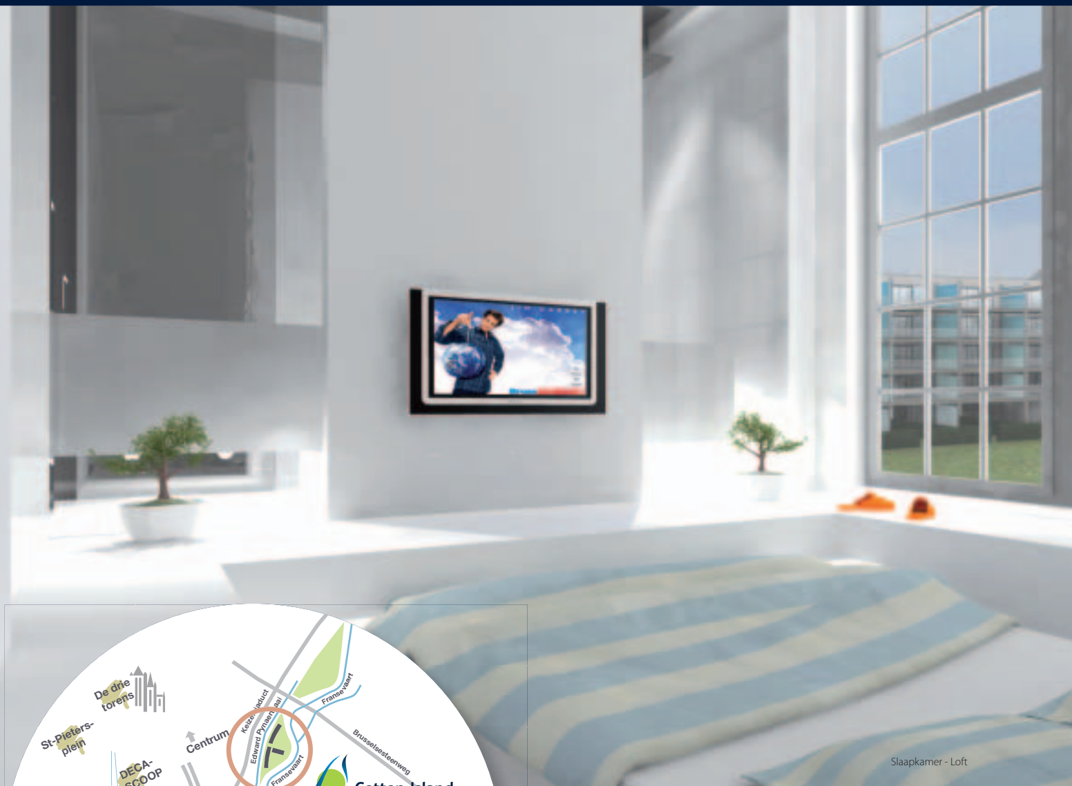
Slaapkamer - Loft

Uitstekend gelegen op wandelafstand van Gent Centrum, vlakbij alle op- en afritten